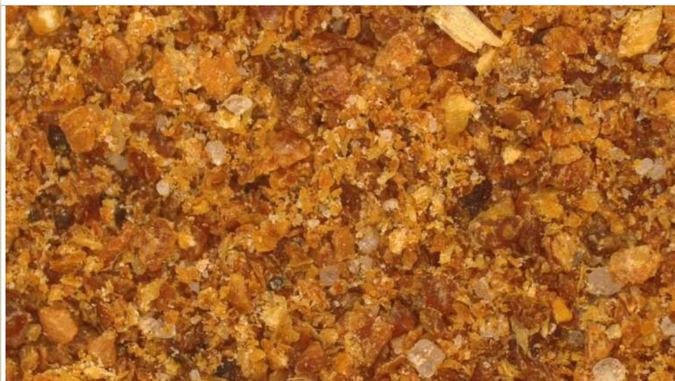
Фото 1 – увеличение x12 общий вид.

Представленный образец является смесью приблизительно следующего состава: послеспиртовая пшеничная барда, имеющая характерный запах, кристаллы сульфата аммония.