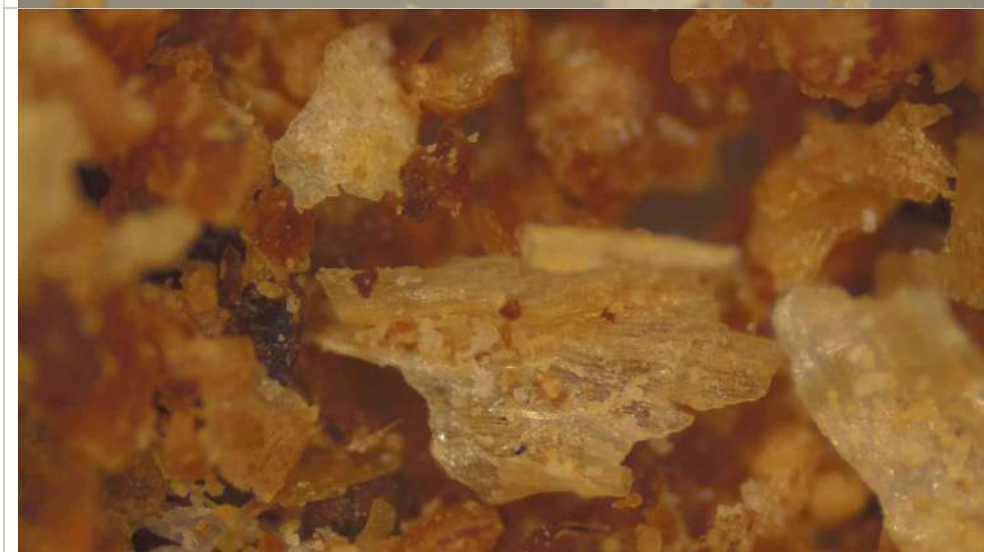
Фото 3 – увеличение x100 пшеничные отруби